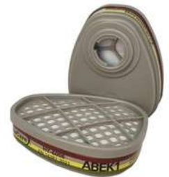
Cartucho Contra Gases Multiples