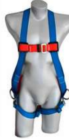
Arnes Cuerpo completo 3 Anillos 3M