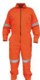
Overol Con Reflejante Naranja Talla Ch a 4XL SKU: 51008