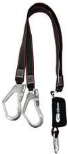
Eslinga con Absorbedor de Impacto Climax