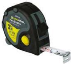
Flexometro 3Mts Anti Impacto Aksi