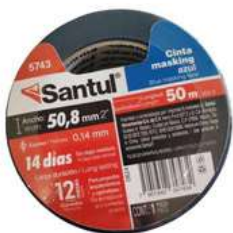
Cinta Masking Azul 2" x 50M Santul