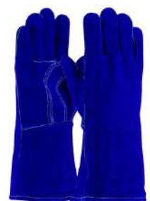
Guante de Soldador Hilo de Kevlar Azul SKU: 20039