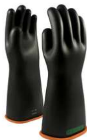
Guantes Novax Clase 3 16" y 18"