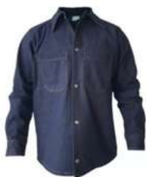
Camizola 8 Oz sin Reflejante (Ch, M, L, XL)