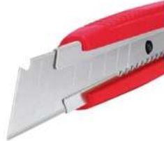
Cutter Alma Metalica 6" Aksi