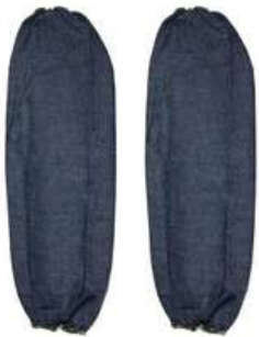
Manga de Mezclilla