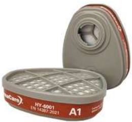
Cartucho Contra Vapores Organicos