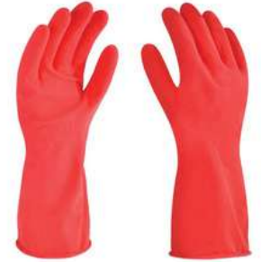
Guante de latex tipo Domestico Rojo