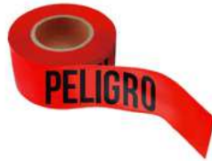
Cinta delimitante de Peligro