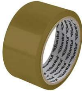
Cinta de Canela 150 M Santul