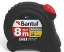
Flexometro 8Mts Auto Lock Santul