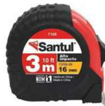
Flexometro 3Mts Contra Impacto Santul