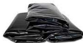
Bolsa para Basura 70x90 - 90x120