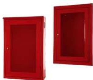
Gabinete para hidrantes