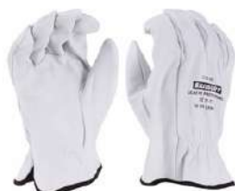
Guante de Piel