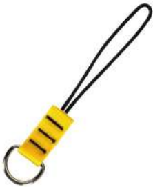
Protección Caída de Herramientas 3M