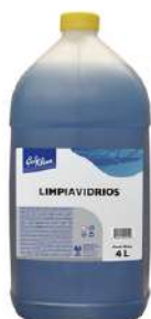
Porrón Limpia Vidrios