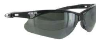
Lente Tipo Nemesis Oscuro SKU: 10011