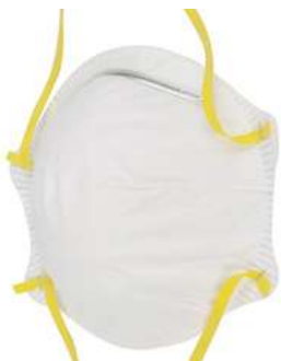
Cubreboca sin Valvula N95 20Pz