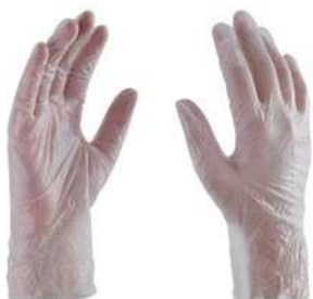
Guante Vinyl Desechable c/polvo