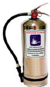
Extintor Clase "K"