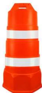
Trafitambo con Reflejante