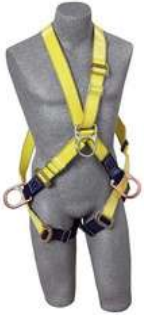
Arnes Delta Recubierto de Poliuretano 3M