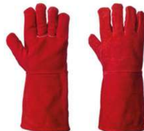
Guante de Soldador Hilo de Kevlar Rojo SKU: 20038