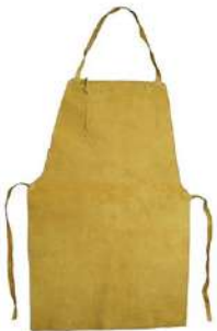
Mandil de Carnaza