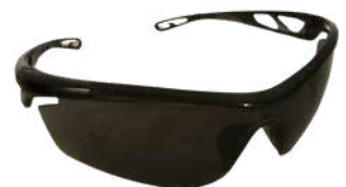
Lente Reflejante Oscuro SKU: 10009