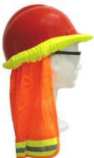
Cubre Nucas para casco