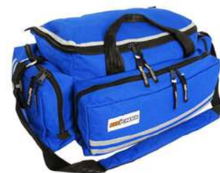
Botiquin Reximed Equipado