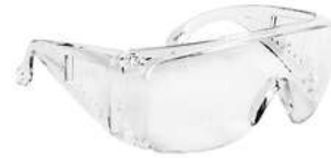
Lente Visitante Claro SKU: 10003