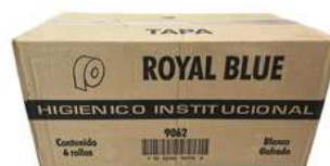
Papel Higienico Royal Jr C/12 o Jumbo C/6