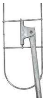
Trapeador tipo Avion