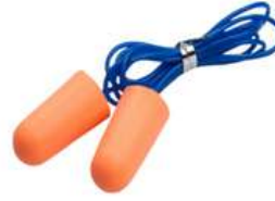
Tapon Auditivo Desechable