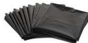
Bolsa para Basura 50x70