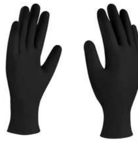
Guante Nitrilo Desechable Negro