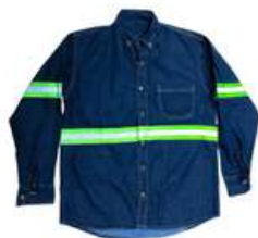
Camizola 8 Oz con Reflejante (Ch, M, L, XL)