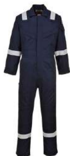
Overol Ignifugo SKU: 51011