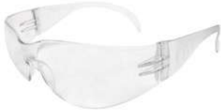
Lente claro Antiempañó SKU: 10001