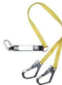
Absorbedor Gancho Doble Dermacare