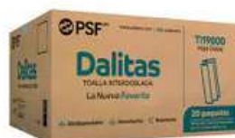
Toalla Interdoblada Dalitas