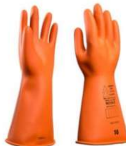
Guantes Novax Clase 0 11" y 14"