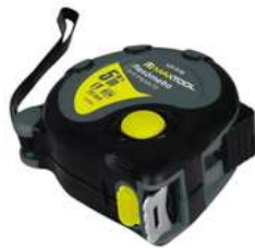
Flexometro 5Mts Anti Impacto Aksi