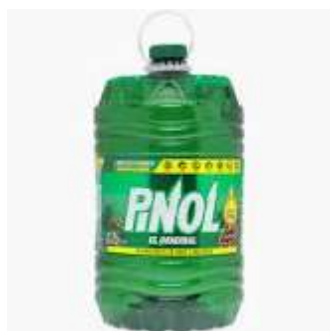
Porrón Pino Generico