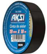
Cinta Aislante Negra 19Mm X 18Mts Aksi