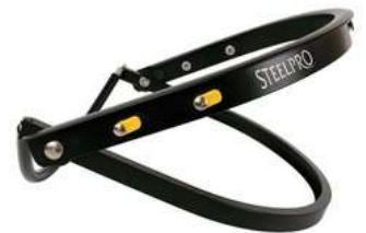
Adaptador Universal Steelpro