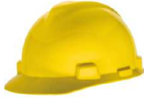
Casco tipo Cachucha c/Matraca