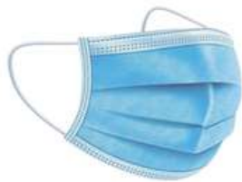
Cubreboca Desechable Azul