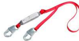
Linea de Vida Protecta 3M