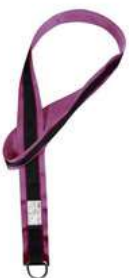
Anclaje Dielectrico Climax