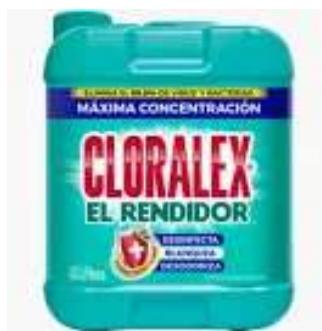
Porrón Cloro Generico