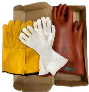
Kit de Guantes Marca Adex