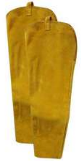
Manga de Carnaza