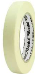
Cinta Masking 3/4" x 50M Santul