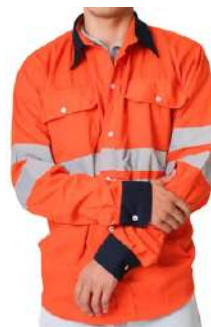
Camizola Naranja Con Reflejante