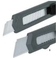
Cutter Plastico de 6" Gris Aksi