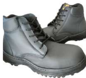
Botas Industriales Talla 22 a 31