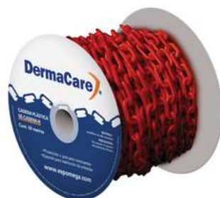
Cadena Plastica Roja 50Mts