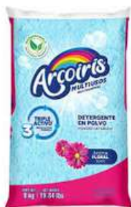
Detergente Arcoiris 9Kg