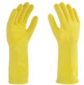
Guante de latex tipo Domestico Amarillo