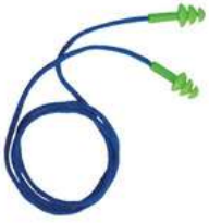
Tapon TPR SteelPro