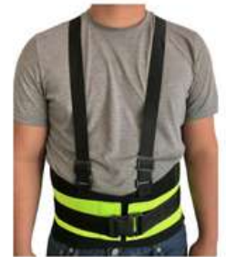
Faja de 3er Cinto C/Reflejante