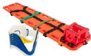
Kit de Camilla Inmovilizadora