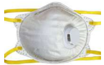
Cubreboca con Valvula N95 20Pz