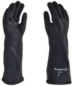
Guante Contra Acidos 18" Negro