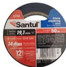
Cinta Masking Azul 3/4" x 50M Santul