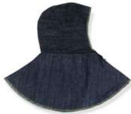
Capucha de Mezclilla