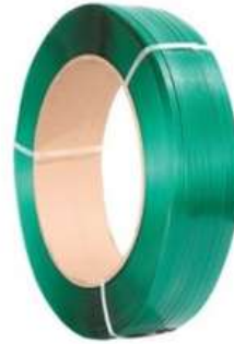
Fleje Moleteado PET