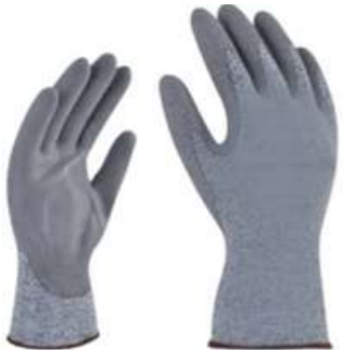
Guante Anticorte Nvl 5 SKU: 20025