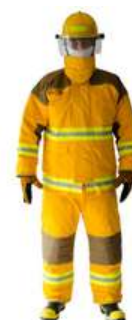
Trajes para Bomberos