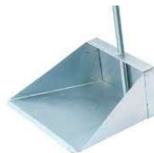
Recogedor de Lamina Grande