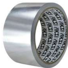
Cinta de Aluminio 30 M Aksi