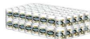
Higienico Kleenex 80 Pz