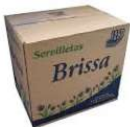
Servilletas Brissa 12 Pz