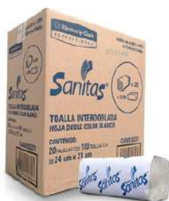
Toalla Interdoblada Sanitas