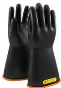
Guantes Novax Clase 2 14" y 16"