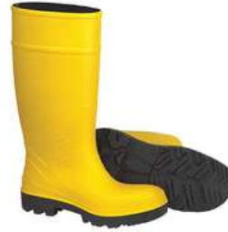
Botas Dielectricas con Casquillo