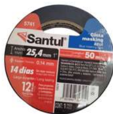
Cinta Masking Azul 1" x 50M Santul