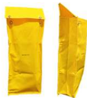
Funda para Guantes