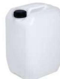
Envase de Galon c/tapa