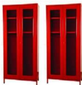
Gabinete para trajes de bombero