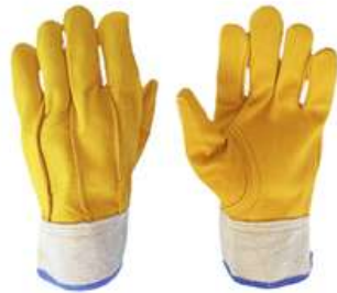
Guante de Electricista