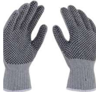
Guante Japones con Puntos PVC