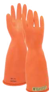
Guantes Novax Clase 00 11" y 14"