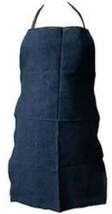
Mandil de Mezclilla s/Bolsas