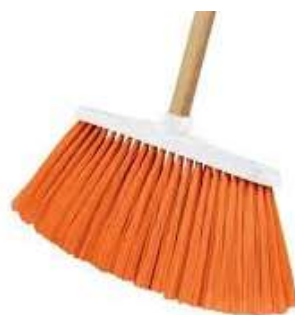
Escoba tipo Cepillo Largo