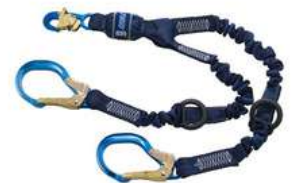
Eslinga Doble Sala Force 3M