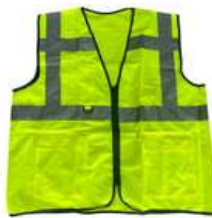
Chaleco de Alta Especialidad