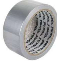
Cinta para Ducto 30M Santul