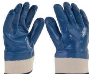
Guante de Nitrilo Puño de Lona