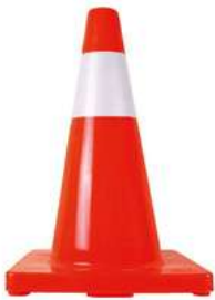
Cono 45 cm Naranja con Reflejante