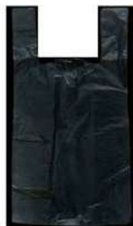
Bolsa Grande Tipo Camiseta