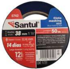
Cinta Masking Azul 1-1/2" x 50M Santul