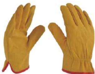
Guante de Operador