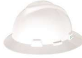
Casco Ala Completa c/Intervalo