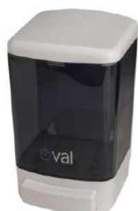
Despachador de Jabon OVAL