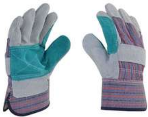
Guante Chino Doble Palma