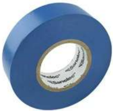
Cinta Aislante Azul 19Mm X18Mts Sanelec