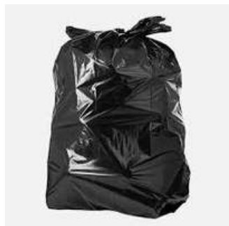
Bolsa Para Tambo