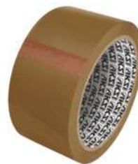
Cinta de Canela 50 M Aksi