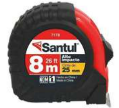
Flexometro 8Mts Contra Impacto Santul