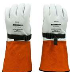
Guante de Algodon