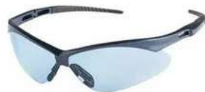
Lente Tipo Nemesis Claro SKU: 10010