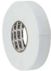
Cinta de Montaje 5Mts X 19Mm Aksi