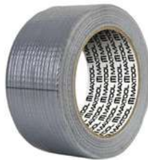
Cinta para Ducto 10M Aksi