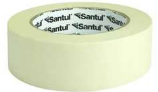
Cinta Masking 1-1/2" x 50M Santul