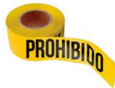
Cinta delimitante de Prohibido