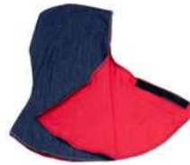
Capucha de Mezclilla con Forro