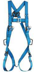
Arnes Ignifugo Climax