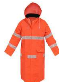
Impermeable Gabardina Naranja M a XL SKU: 51006