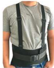
Faja de 3er Cinto