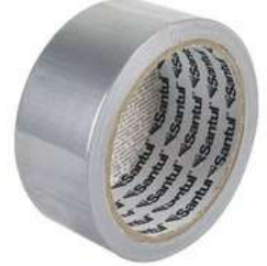
Cinta para Ducto 10M Santul