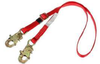
Linea de Posicion Ajustable 3M