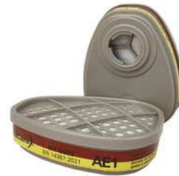
Cartucho contra Vapores Organicos y Acidos