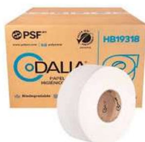
Papel Higienico Dalia Jr C/12 o Jumbo C/6