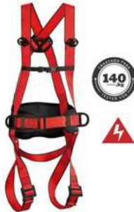
Arnes Maxipro Dielectrico Climax