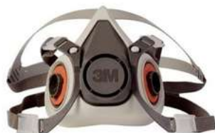
Respirador Media Cara 3M