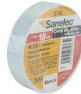
Cinta Aislante Blanca 19Mm X18Mts Sanelec