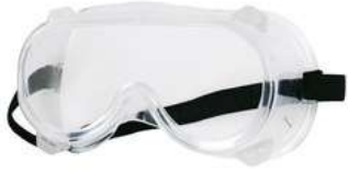
Gogle Ventilacion Indirecta SKU: 10012