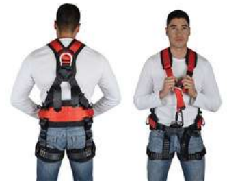
Arnes de 3 Anillos con Faja Dermacare