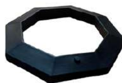
Base de Trafitambo