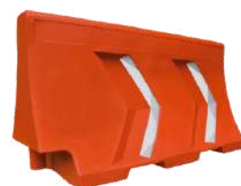
Muro divisorio con 4 reflejantes