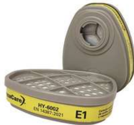
Cartucho Contra Gases Acidos