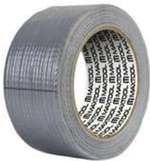
Cinta para Ducto 30M Aksi