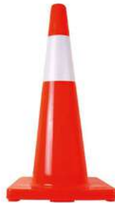
Cono 71 cm Naranja con Reflejante