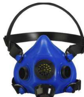
Respirador Media Cara