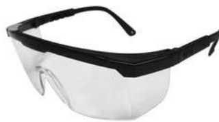
Lente Claro Armazón Negro SKU: 10006