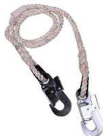
Linea de Vida Dermacare