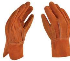
Guante de Carnaza Corto