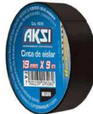
Cinta Aislante Negra 19Mm X 9Mts Aksi