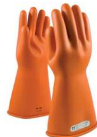
Guantes Novax Clase 1 14"