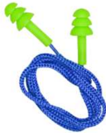
Tapon Auditivo Reutilizable