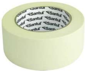
Cinta Masking 2" x 50M Santul