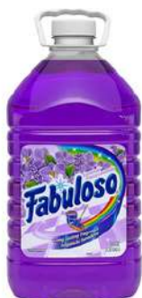
Porrón Fabuloso Generico