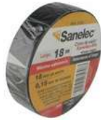
Cinta Aislante Negra 19Mm X18Mts Sanelec