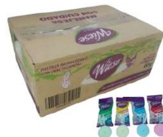
Pastilla Wiese C/50 pz