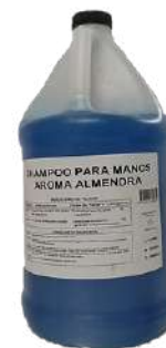
Porrón Shampoo Para Manos