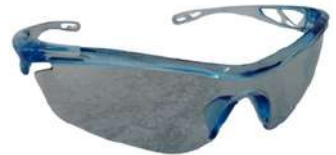
Lente Reflejante Claro SKU: 10008