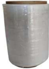
Rollo 5" Pelicula Plastica 5-50-600