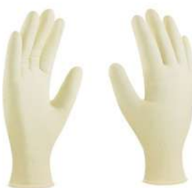
Guante latex Desechable C/polvo