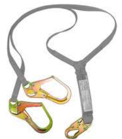
Eslinga con Absorbedor Doble First 3M