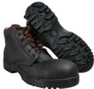
Botas Ind. avanza Tallas 3 a 10