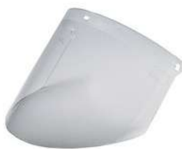
Mica Facial Anti Empaño 3M 10Pz