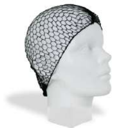
Cofia de Malla Negra