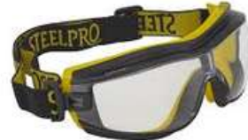
Gogle Steel Pro SKU: 10024