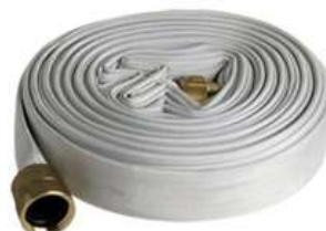
Manguera para Hidrantes