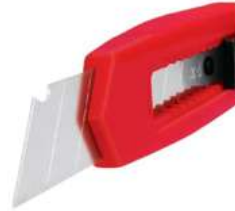
Cutter Plastico de 6" Rojo Aksi