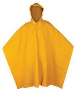
Impermeable Capamanga Unitalla SKU: 51003