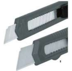
Cutter Plastico de 5" Gris Aksi