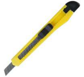
Cutter Plastico de 5" Keer