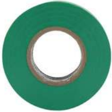
Cinta Aislante Verde 19Mm X18Mts Sanelec