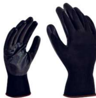
Guante Nylon Rec Nirtilo SKU: 20022