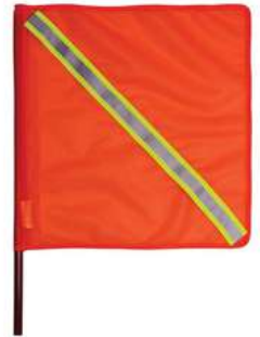
Banderola Fluorecente con Reflejante