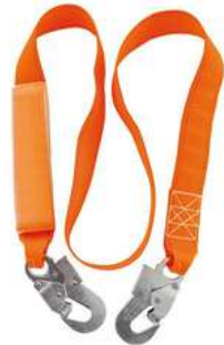
Absorvedor de Impacto Dermacare