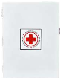
Caja para Botiquin de Primeros Auxilios