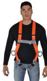
Arnes de 3 Anillos Dermacare