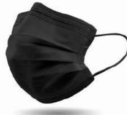
Cubreboca Desechable Negro