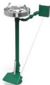
Estación de Lavaojos