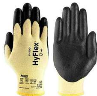
Guante Resistente a corte Hy-Flex 11-510 SKU: 20044