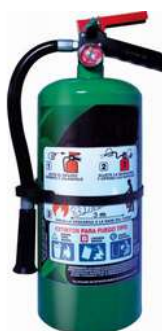
Extintor HFC236 Agente limpio