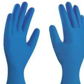
Guante Nitrilo Desechable Azul