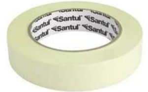
Cinta Masking 1" x 50M Santul