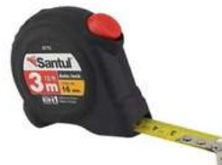
Flexometro 3Mts Auto Lock Santul