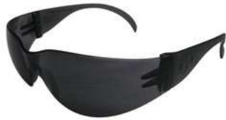
Lentes Oscuros SKU: 10005