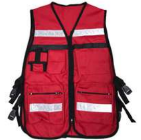
Chaleco Brigadista Premium