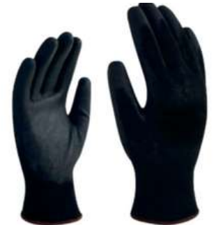
Guante Nylon Rec Poliuretano SKU: 20023