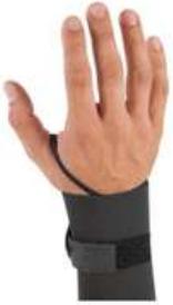
Muñequera dedal de 3"