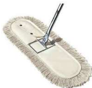
Repuesto para trapeador Avion