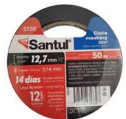
Cinta Masking Azul 1/2" x 50M Santul