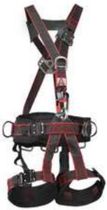
Arnes Atlas Climax