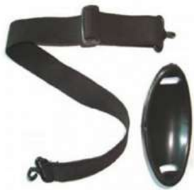
Barbiquejo Con Mentonera