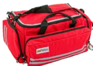
Botiquin Reximed Plus