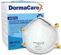
Cubreboca N95 50Pz