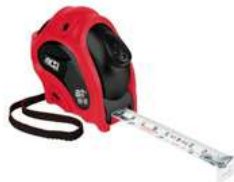
Flexometro 5Mts Anti Impacto Premium Aksi