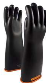
Guantes Novax Clase 4 16" y 18"