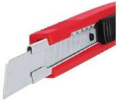
Cutter Alma Metalica 5" Blister Aksi