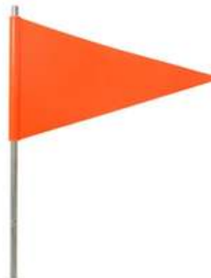
Banderin para Camion