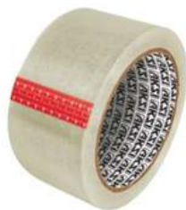
Cinta Transparente 50M Aksi