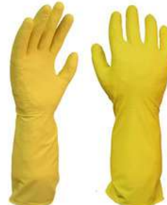
Guante Nitrilo Uso General Amarillo