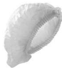
Cofia Desechable Plisada