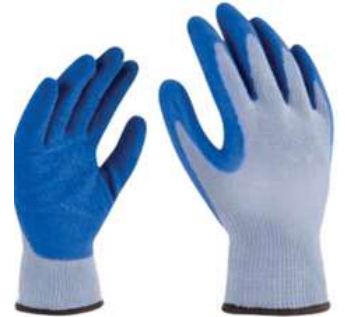
Guante Japones con Palma de Latex