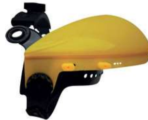
Cabezal Universal Steelpro