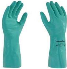
Guante Nitrilo resistente a quimicos Verde