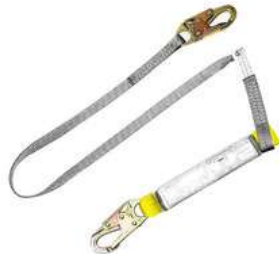
Linea de Vida Con Amortiguador 3M