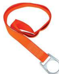
Punto Fijo Dermacare