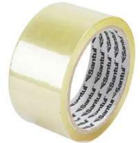
Cinta Transparente 150M Santul