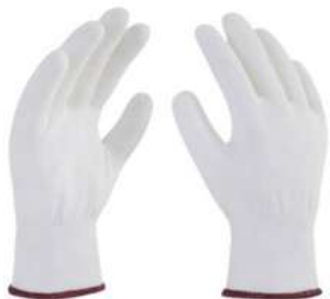
Guante Nylon Blanco Rec Poliuretano SKU: 20024