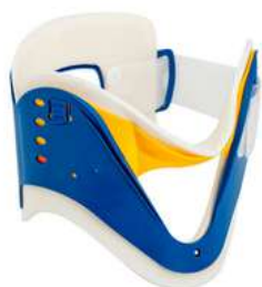
Collarin Ajustable Rexponder