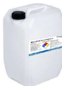
Porrón de Alcohol Isopropilico