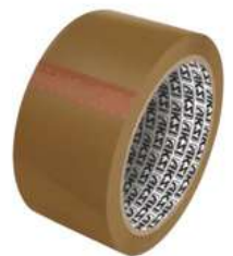
Cinta de Canela 40 M Aksi