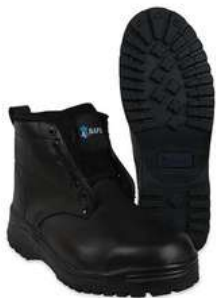
Botas Industriales Talla 3 a 11