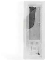
Cuchillas p/Navaja 6" 10Pz Aksi