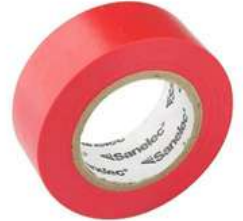
Cinta Aislante Roja 19Mm X18Mts Sanelec