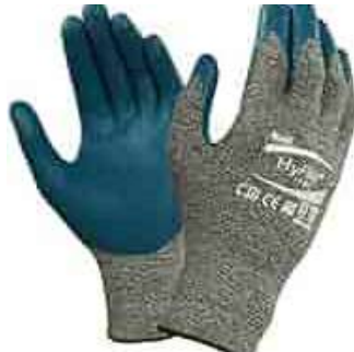
Guante Anticorte Nvl 5 Hy-Flex 11-501 SKU: 20030