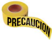
Cinta delimitante de Precaución