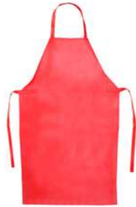
Mandil de PVC