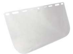
Mica Facial Clara Dermacare