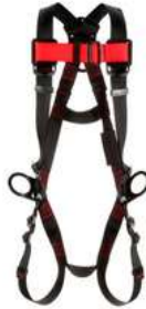
Arnes Protecta 3 Argollas 3M