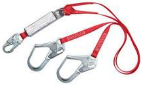
Eslinga Doble Protecta 3M