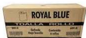
Toalla Rollo Royal