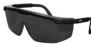
Lente Oscuro Armazon Negro SKU: 10007