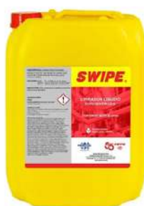
Porrón de Swipe