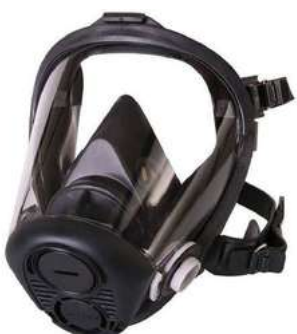
Respirador cara completa