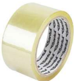
Cinta Transparente 50M Santul