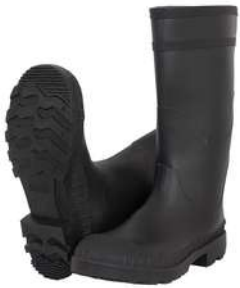
Botas Jardineras Turbo