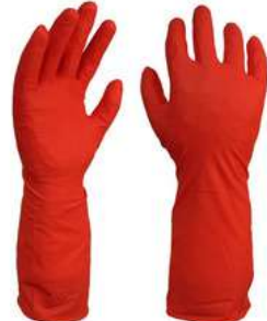
Guante Nitrilo Uso General Rojo