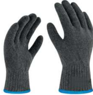
Guante Japones 60 Gr