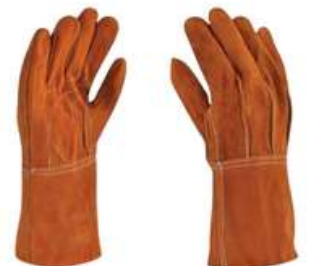
Guante de Carnaza Largo