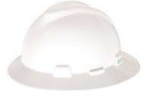
Casco Ala Completa c/Matraca