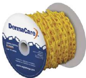
Cadena Plastica Amarilla 50Mts