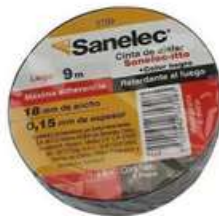
Cinta Aislante Negra 19Mm X 9Mts Sanelec