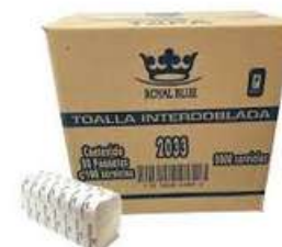
Toalla Interdoblada Royal