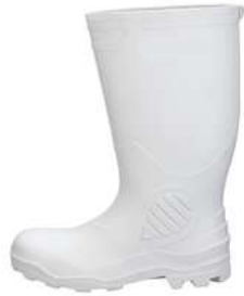
Botas Sanitarias Turbo