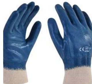
Guante de Nitrilo Puño Elastico