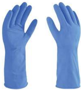
Guante de latex tipo Domestico Azul