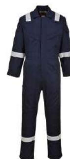
Overol Industrial SKU: 51010